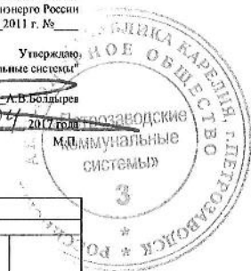
Стоимость основных этапов работ по реализации инвестиционной программы сетевой компании на 2017-2019 год